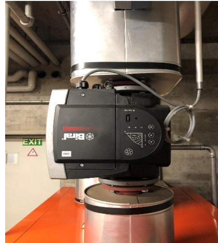
A05 - Pompes de chauffage à régulation de vitesse électronique ultramodernes