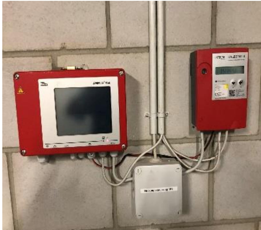
A04 - Comptabilisation individuelle des frais de chauffage avec décompte précis de la consommation